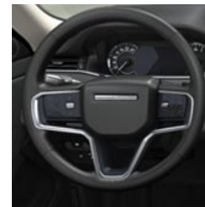
PIANTONE DELLO STERZO